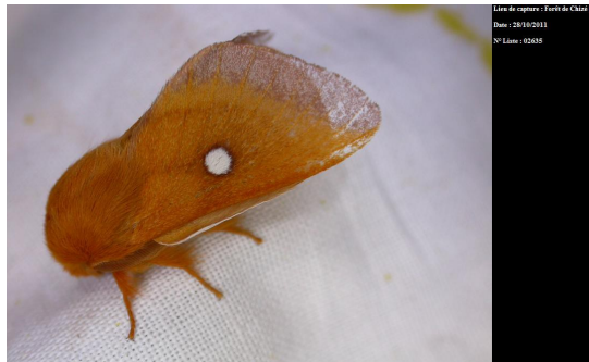
Laineuse du prunellier

Quelques exemples de macro-hétérocères (les chiffres avant le nom de l'espèce correspondent à la classification Leraut) nouveaux pour le département (source : Delachaux et niestlé, Guide des papillons nocturnes de France, coordonné par Roland Robineau) :