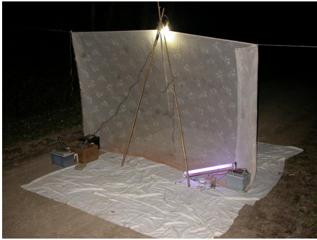
Drap lumineux (A. Guyonnet)