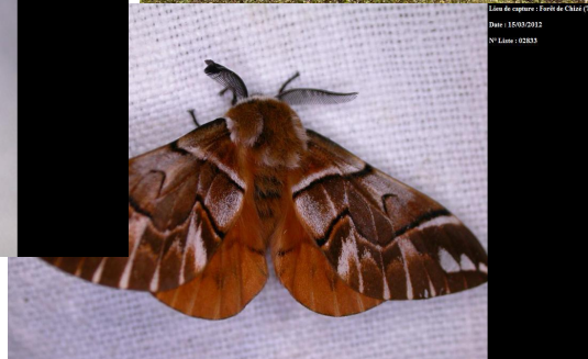
Ligne de capture : Forêt de Chizé (79) Date : 15/03/2012 N° Ligne : 02833