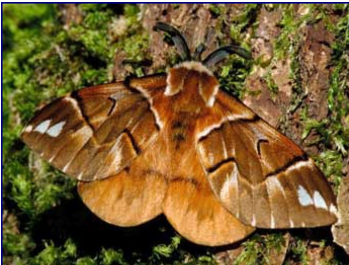
Mâle, Lembach (Bas-Rhin), 17 mars 2007.

Situation actuelle - 2011 (Guyonnet Antoine) : Espèce qui n'a plus été revue en forêt de Chizé depuis les années 2000. Rare et localisée.