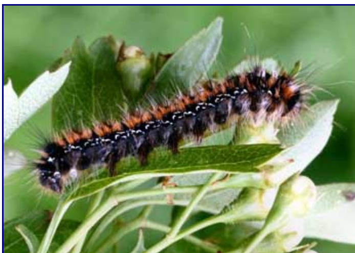
Chenille . Photo David Demerges